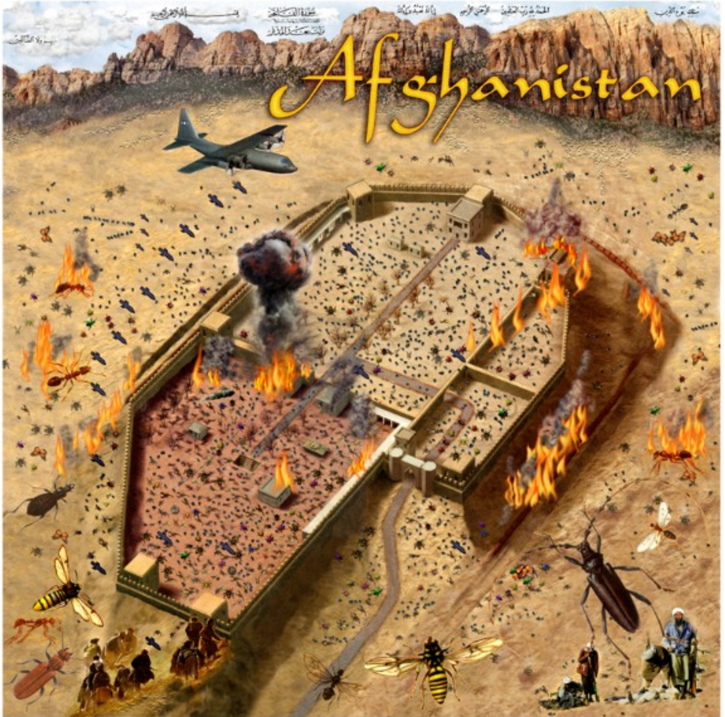
Battle of Mazar-i-Sharif 2001