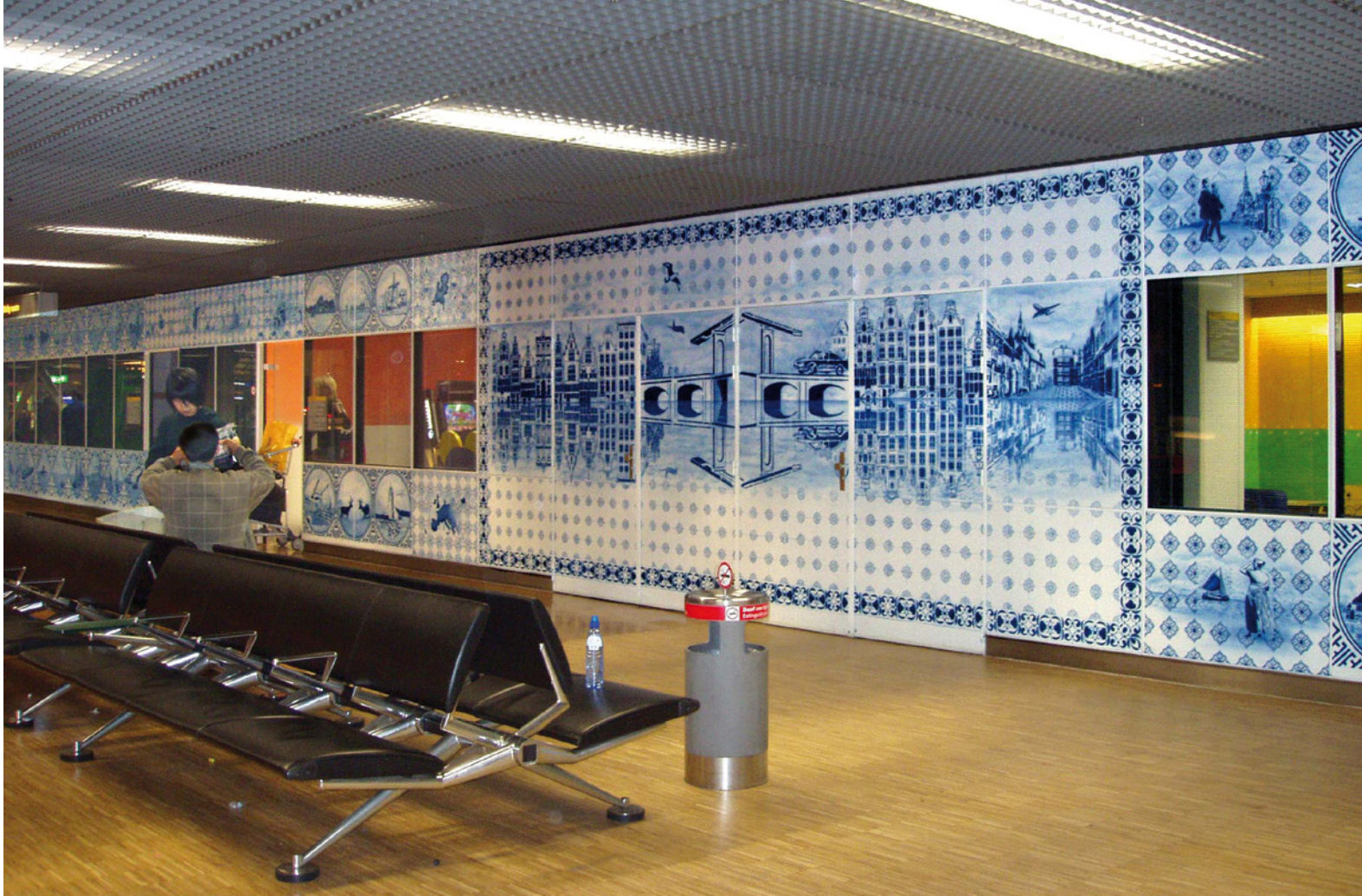
Hugo Kaagman, Nice Trip , 1993; inkt en airbrush op papier, sjablonen in laminaat; Terminal West, Schiphol, 1993; lengte 70 meter, hoogte 3,8 meter.

voor te bedenken. Ze worden gestileerd en op de computer bewerkt." In september gaat Hugo Kaagman naar China om ontwerpen uit te voeren in opdracht van de gemeente Delft.