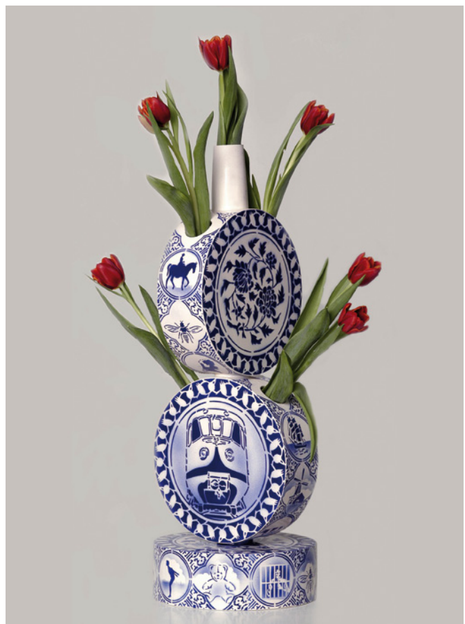
Hugo Kaagman, Tulpenvaas , The EKWC presents Dutch Souvenirs at the Salone Internazionale del Mobile in Spazio Consolo - Milano, Italy 9-14 april 2003; keramiek met onderglazuur, sjablonen; h. 35 cm.