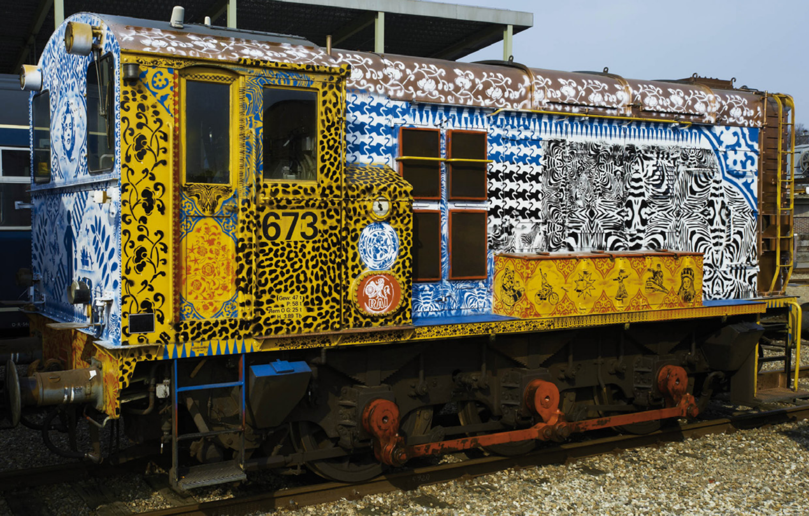
Hugo Kaagman, Locomotief in het Spoorwegmuseum, 2012. De beschilderde treinstellen zijn permanent te zien.

In 1996 werkte Kaagman drie maanden in het Europees Keramisch Werkcentrum in De Bosch en 'ging daarna helemaal los'. "Vanaf die tijd ben ik zelf met klei bezig gegaan. Vooral tegels en schotels. Ik kocht een oven en bakte zelf, kleine series, maar geen productiewerk. In 2000 ben ik nog een keer terug geweest en heb toen ook gewerkt op Curaçao. Daar heb ik een serie eilanden in Delfts blauw gemaakt. In diezelfde tijd heb ik gewerkt in Vallauris (Provence), waar ik borden en schalen mocht ontwerpen."