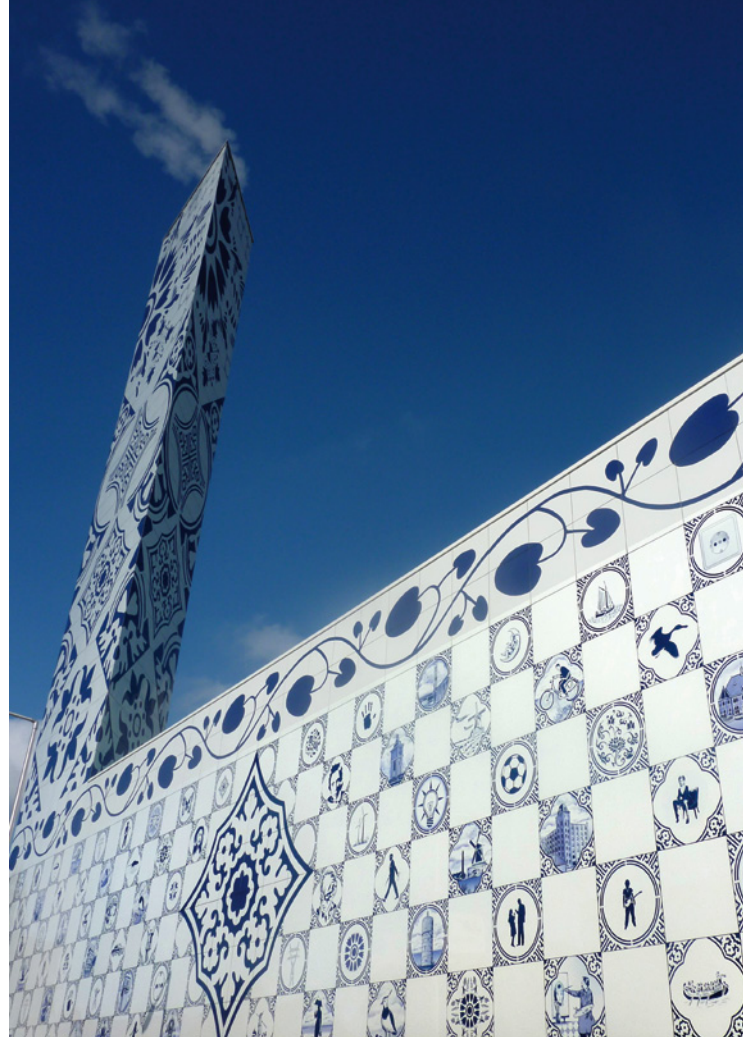
Hugo Kaagman, Stadshaard Enschede, 2010, sjablonen en digitale print; 1500 m 2 aluminium platen van 100 x 100 cm.