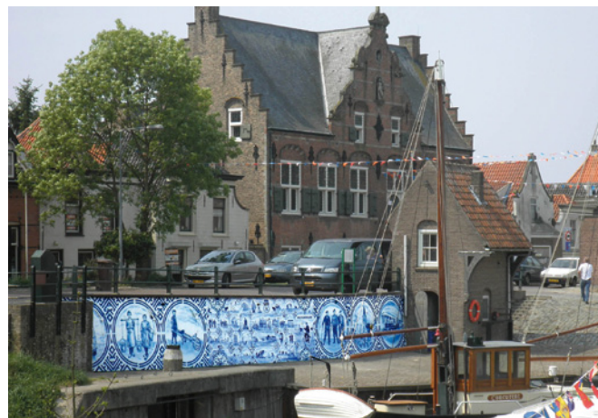
Hugo Kaagman, De Kaai van Ooltgensplaat, 2011; airbrush en sjablonen op kade; lengte 20 meter, hoogte 2 meter

De tegel vormt een belangrijk onderdeel van het werk van Kaagman. Alle verhalen komen op die tegels bij elkaar. "De tegelthematiek is door de eeuwen heen niet zoveel veranderd: soms wat belerend, vaak oubollig, verhalend, herkenbaar. Die uitgangspunten hanteer ik ook, maar dan anno nu. Voor de hoeken gebruik ik motieven uit allerlei landen, zoals Frankrijk (de lelie), China, Spanje, Marokko, Italië, Nederland. Het zijn vrijwel uitsluitend traditionele patronen; maar die zijn goed en blijven goed, daar hoeft ik niet iets nieuws